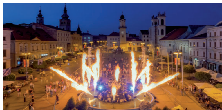
Ilustračné foto DMK 2025.